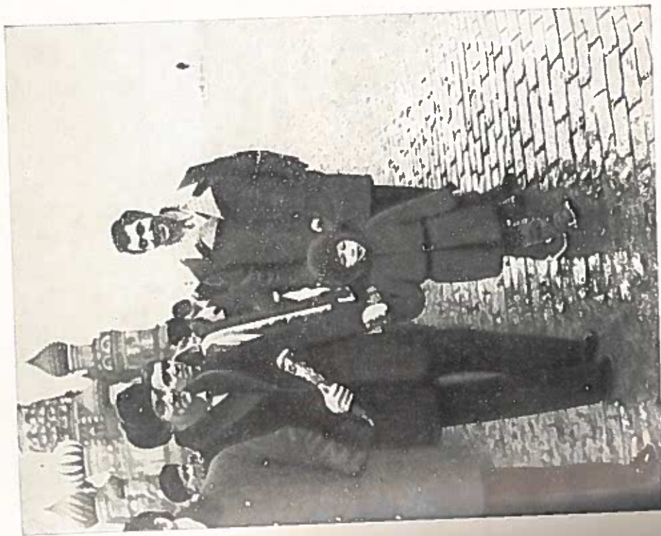
На Красной площади перед отъездом в Канаду на первом встречи с профессионалами