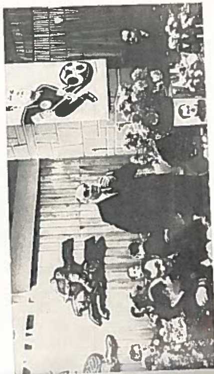
Тренеры сборной команды СССР Всеволод Бобров и сборной команды профессионалов ИХЛ Гарри Сиден в время первой «суперсерии» в 1972 году