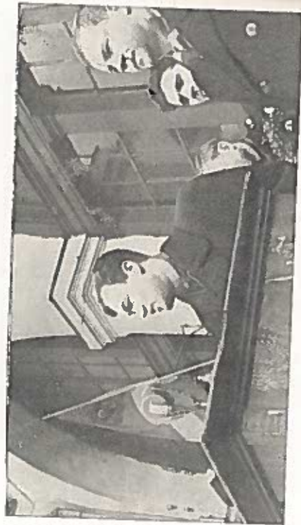
Всеслод Гобров кормит голубей на Трафальгар-сквер Гобров выступает на митинге после возвращения из Стокгольма с победного чемпионата мира по хоккею с шайбой (1954 г.)