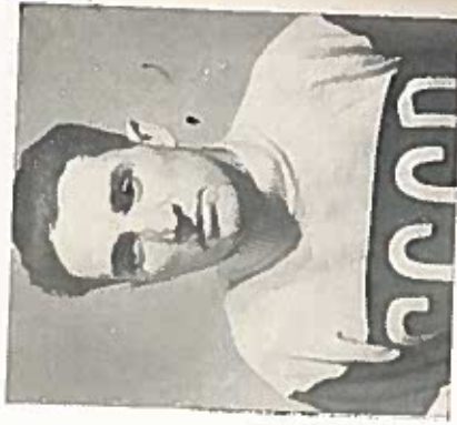
Евгений Бабич — лучший правый крайний нападающий в советском хоккее конца 40-х — начала 50-х годов. Выступал в знаменитой тройке с В. Бобровым и В. Шуваловым