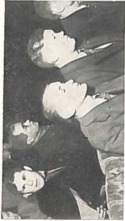
Московское «Динамо» в Англии