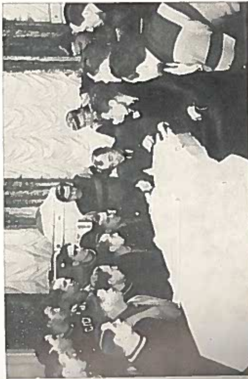
Армейские футболисты в Потсдаме