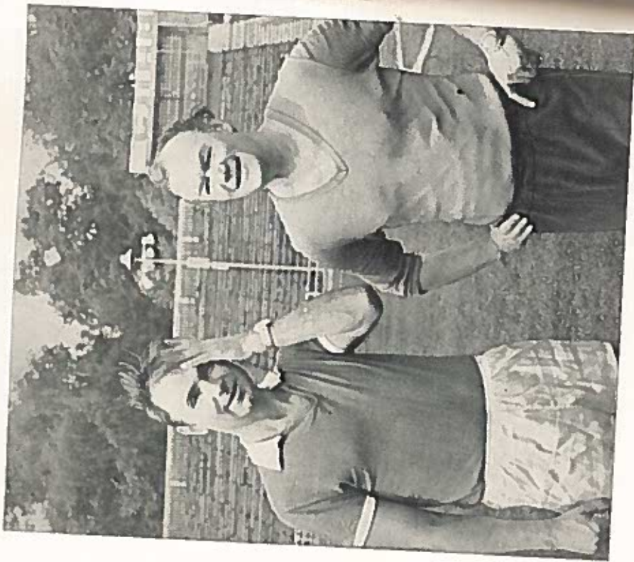
Тренеры Всеволод Бобров и Виктор Тихонов. Оба когда-то играли в хоккейной команде ВВС, оба впоследствии стали наставниками сборной СССР по хоккею с шайбой