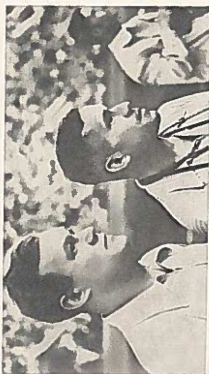
Всеволод Бобров и Алексей Хомич — в роли тренера и фотокорреспондента