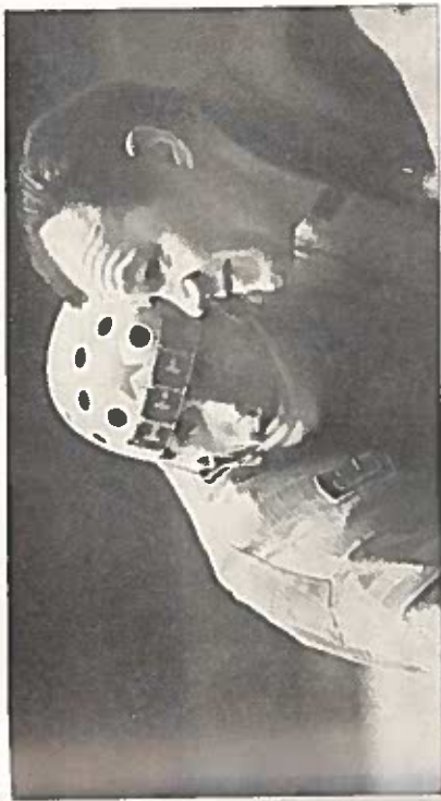
Уважение спортсменов к тренеру Боброву было беспредельным