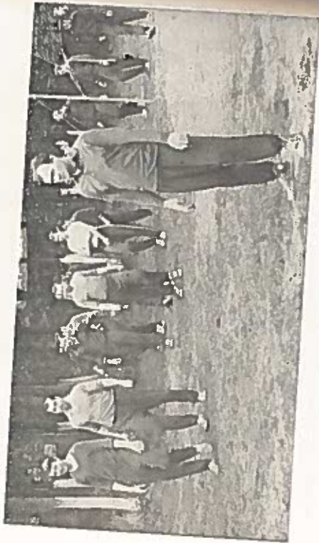
Всёволод Михайлович Бобров работает с футболистами Демократической Республики Вьетнам В роли старшего тренера хоккейной команды «Спартак» (Москва)